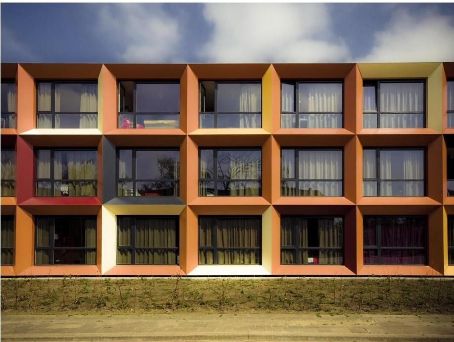
Foto's van eenvoudige en luxere woonunits

Het mag duidelijk zijn, dat we slechts een paar voorbeelden willen laten zien, om een idee te hebben van wat er allemaal mogelijk is op dit gebied.