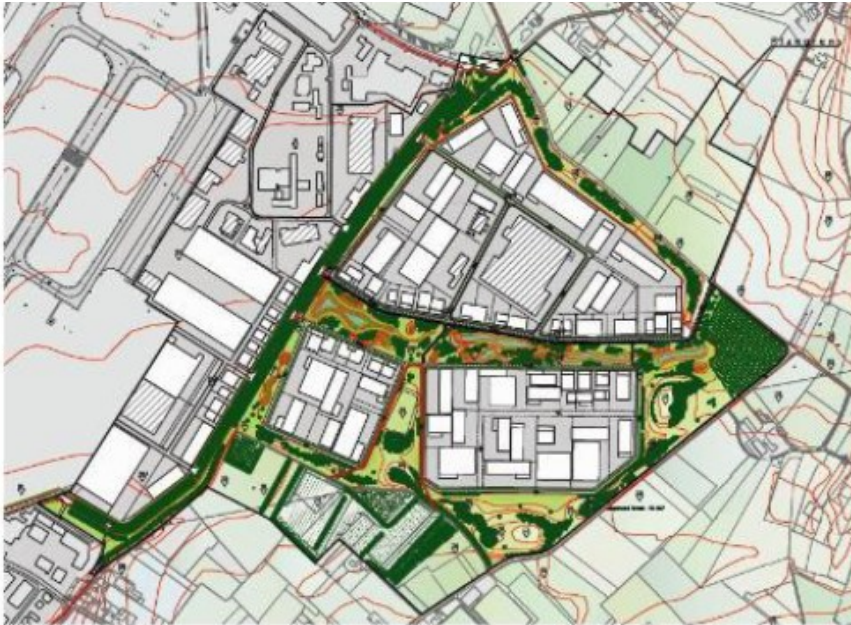
Figuur 5. Plangebied AviationValley.

Door Taken Landschapsplanning is in 2005 een Natuurcompensatieplan opgesteld specifiek voor dit bedrijventerrein. Het Ministerie heeft ingestemd met de aanleg van het bedrijventerrein onder de voorwaarde dat de maatregelen op het gebied van landschappelijke inpassing en natuurcompensatie vooraf en gelijktijdig met de ontwikkeling van het terrein zouden worden uitgevoerd, teneinde de duurzame instandhouding van de soorten te waarborgen. Een van deze terreinen voor natuurcompensatie ligt precies tussen de twee geplande parkeerterreinen in.